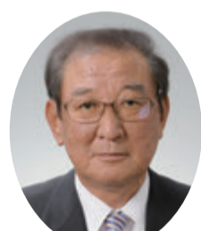
自由民主党 今井 榮喜 議員 (山形市選挙区)

加えての県の支援は、農林漁業者に対する他の支援制度とのバランスや本県水産業への効果等を踏まえ、今後検討する。