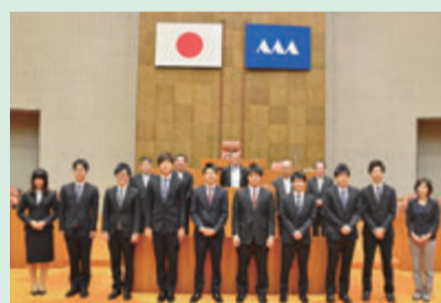
専門学校山形V.カレッジ