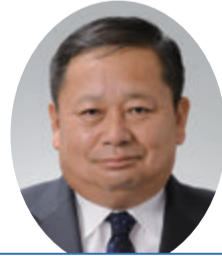
自由民主党 能登 淳一 議員 (村山市選挙区)