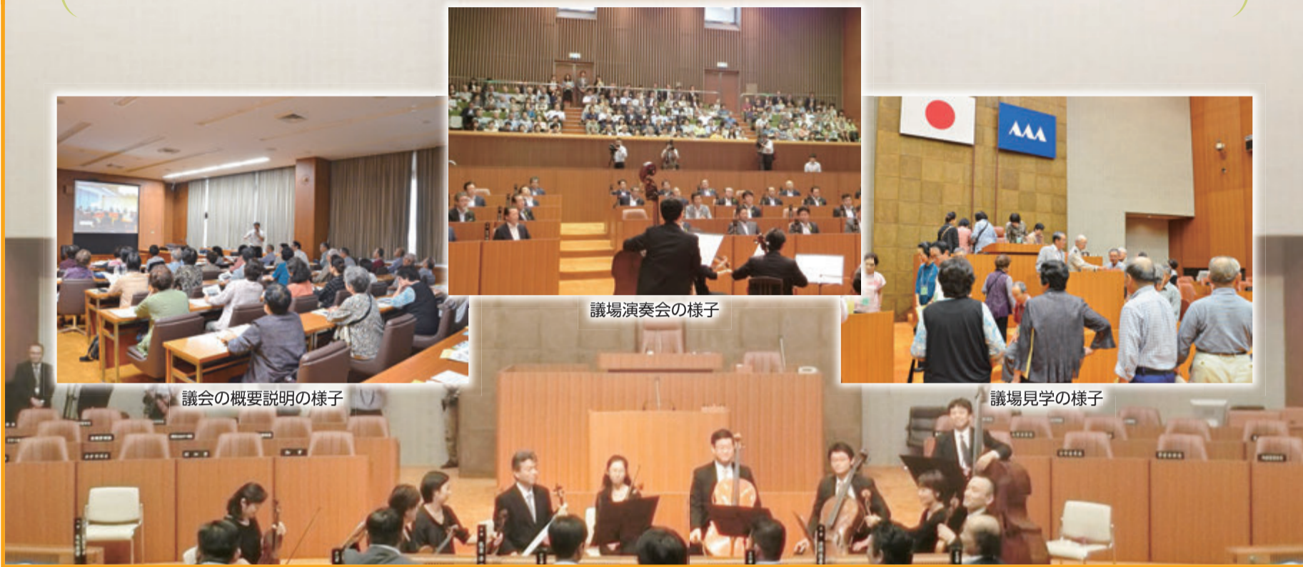
議会の概要説明の様子

参加した皆さんからは、「県議会を身近に感じられて良かった」、「こういった機会があれば、選挙への関心も高くなると思う」、「今度は個人的に傍聴に来てみたい」といった感想が寄せられました。