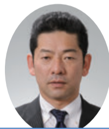
自由民主党 渋間佳寿美 議員 (米沢市選挙区)