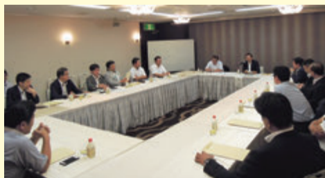
意見交換会の様子