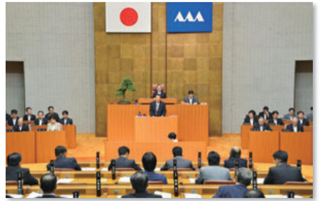
〔9月定例会〕本会議での代表質問