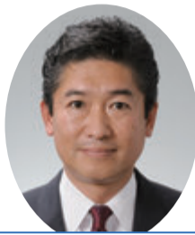
自由民主党 小松 伸也 議員 (最上郡選挙区)

事前通行規制の解除に向けては、宮城県及び近隣市町とこれまで以上に連携した取組みが必要不可欠と考えている。特に、財政負担が必要となる仙台市の理解が必須となるため、知事が率先して仙台市長に働きかけてきた。その結果、山形・宮城両県と仙台市、東根市、天童市による勉強会を発足した。今後、成果を要望書に反映し、連携しながら国土交通省に働きかけていく。