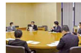
県議会デジタル化推進会議の様子