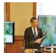
ディスプレイを使った 質疑の様子

12月13日、予算特別委員会で可動式ディスプレイを使った質疑が試行されました。議会のデジタル化の一環として、県議会デジタル化推進会議が試行したもので、映像資料を用いて質疑をよりわかりやすく見せる工夫を行いました。