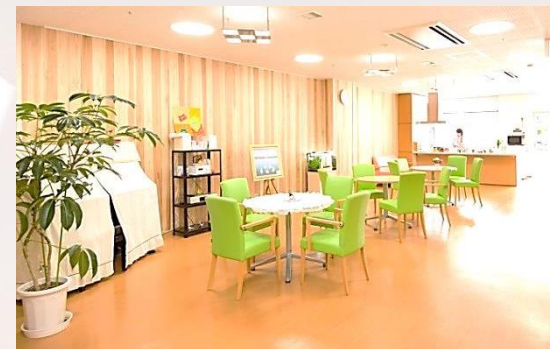
緩和ケア病棟 食堂