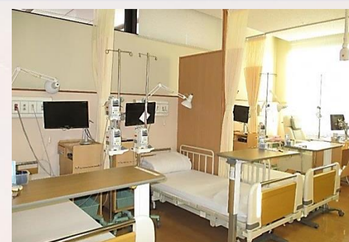
化学療法センター