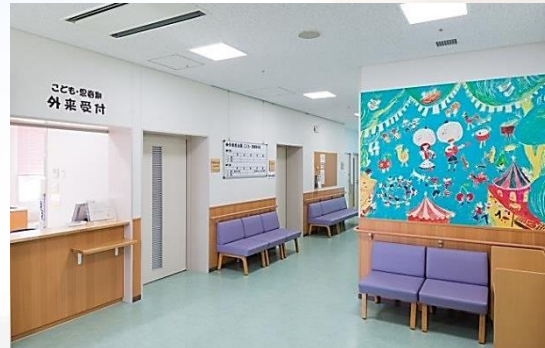
こども・思春期外来