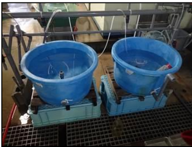
図1 流水水槽 (アربي幼生管理水槽)