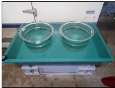
図2 止水水槽 (ウォーターバス方式)