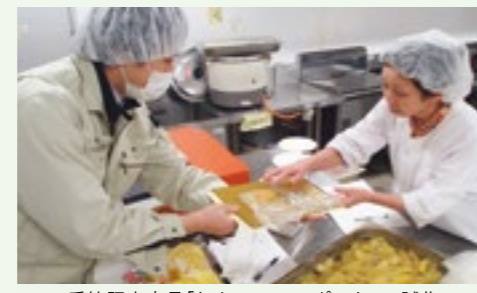
季節限定商品「りんごのコンポート」の試作

直売所の品ぞろえの強化と目玉商品づくりに向けて、紫や黄色、オレンジ色など、カラフルな野菜をそろえることも有効です。県では、農家の方に、こうした目でも楽しめる「彩り野菜」の栽培指導を行っています。また、伝統野菜の認知度向上も兼ねて、伝統野菜を使用した加工食品のトライアル販売等を支援しています。