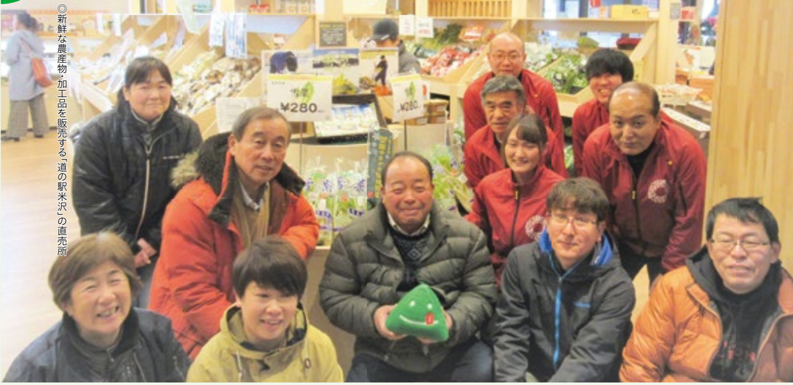
◎新鮮な農産物・加工品を販売する「道の駅米沢」の直売所