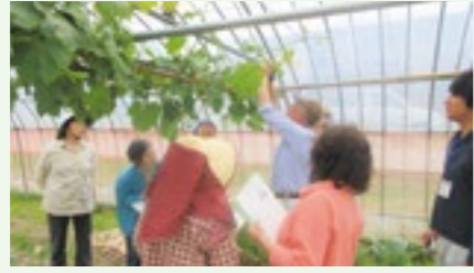
直売所の出荷者向け「シャインマスカット」の栽培管理講習会

情報をわかりやすく伝えられるように、旬の野菜の情報やレシピを学び、接客力を向上させています。