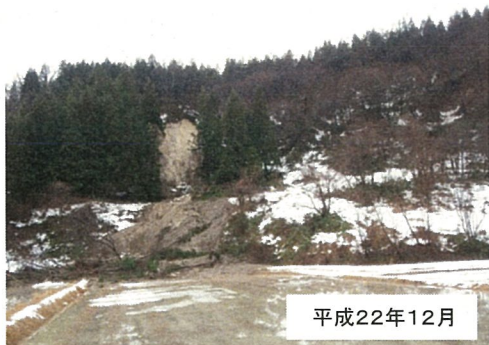
地すべりによる斜面崩壊