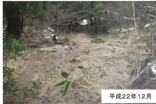
地すべりによる斜面崩壊