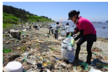
酒田市飛島の海岸での漂着ごみ