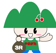
ごみゼロやまがた県民運動キャラクター『ごみゼロくん』