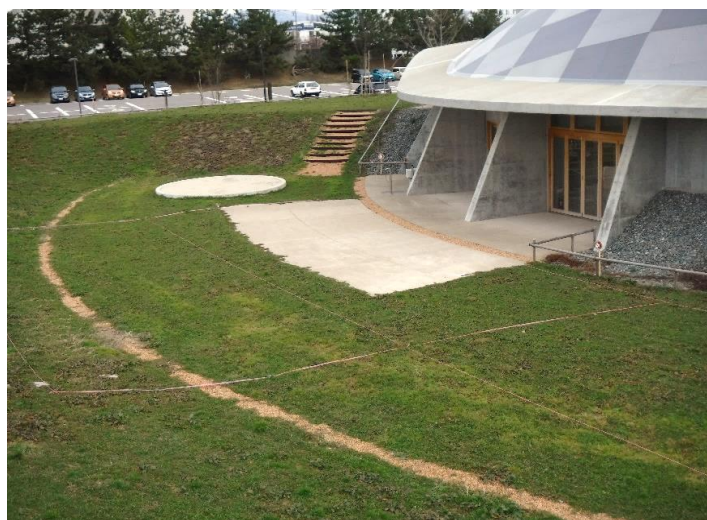
写真 キッズドームソライ建物と外構