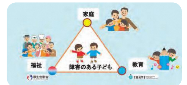
トライアングルプロジェクト

平成30年8月に、学校教育法施行規則の改正が行われ、「個別の教育支援計画」の作成に当たっては、児童生徒等又は保護者の意向を踏まえつつ、医療、福祉、保健、労働等の関係機関等と当該児童生徒との支援に関する必要な情報の共有を図ることが示されました。