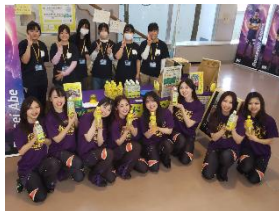
ワイヴァンス会場でレモスタチアのみなさんありがとう！