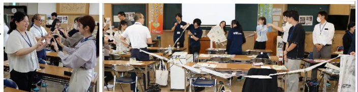
アイスブレイキングでみんな笑顔！あっという間にみんな仲間に！

第4部は「YAMASEI-Café」と銘打って茶話会を行いました。楽しく情報交換していただけたのではないかと思います。