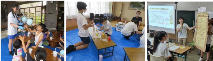
※昨年度の写真です

6月下旬から7月上旬にかけて、県内の中学生・高校生にリーフレットが配布されます。よく読んで、自分で申し込んで、連絡を取り合って、実際にボランティア活動をする、それだけでも素晴らしい社会勉強ですよ♪