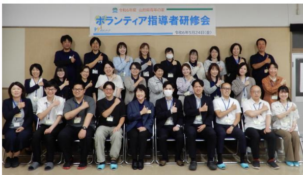
みんなで集合写真「青年の～イエ～イ！」