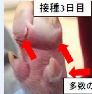
多数の水疱病変を確認