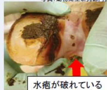
水疱が破れている