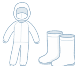
家きん舎専用 衣服・靴の使用