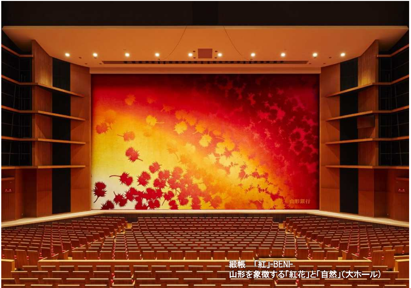
緞帳「紅」-BENI- 山形を象徴する「紅花」と「自然」(大ホール)