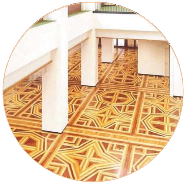
雪の結晶をイメージした木製床面 (ホールホワイエ)